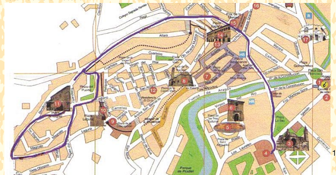
Recorrido de la Procesión

Desde el año 2007 participa el Domingo de Resurrección con la Virgen de los Dolores en el encuentro con su hijo resucitado. Dicho encuentro se realiza en el centro de la ciudad, en el puente del río que cruza la ciudad. La Virgen Dolorosa es trasladada a hombros desde la Parroquia de San Miguel. Es acompañada por hermanos cofrades, que llevan un clavel blanco como símbolo de la resurrección del Señor y por la banda de la Cofradía. Tras esperar un poco a su hijo, y ya enfrente de Él, se despoja del manto negro de Virgen dolorosa para convertirse en Virgen gloriosa. Tras el emotivo encuentro y después de la Santa Misa, la Virgen es trasladada otra vez a la Parroquia para depositarla en su capilla recién restaurada, por la colaboración desinteresada de hermanos cofrades de la Cofradía.