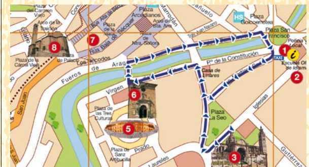
Recorrido de la Procesión