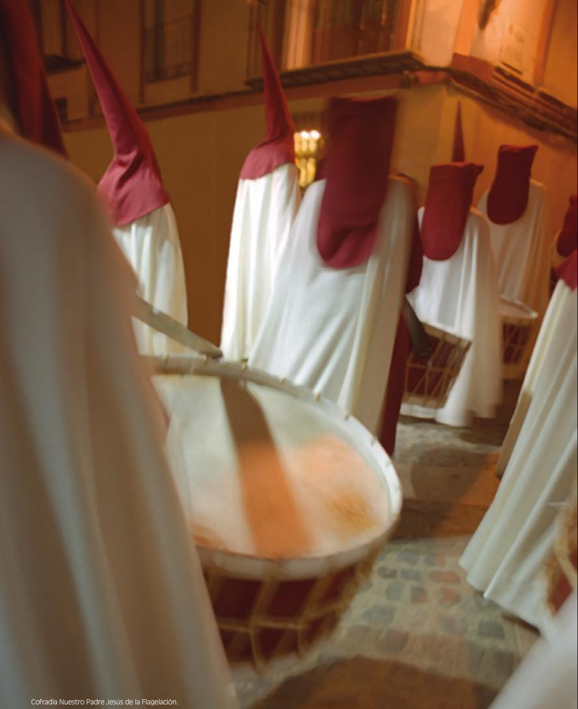
Cofradía Nuestro Padre Jesús de la Flagelación.