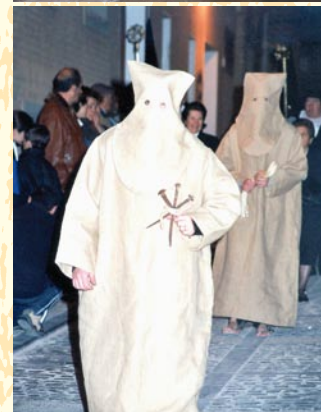
Recorrido de la Procesión