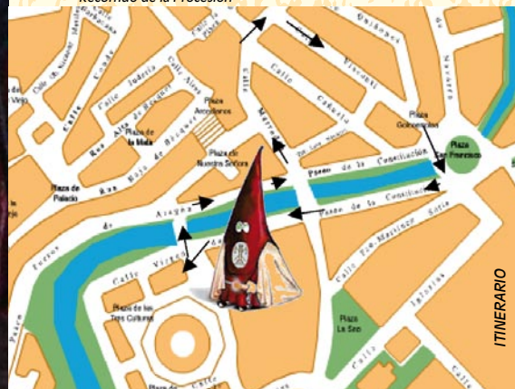
Recorrido de la Procesión

En la actualidad está integrada por un total de 150 hermanos cofrades, entre cofrades honorarios y cofrades procesionales, que acompañan al Paso en la Procesión al son de su clásico toque de tambor y bombo orquestado por la Banda de Tambores y Bombos de la Cofradía y que está compuesta por unos 40 cofrades.