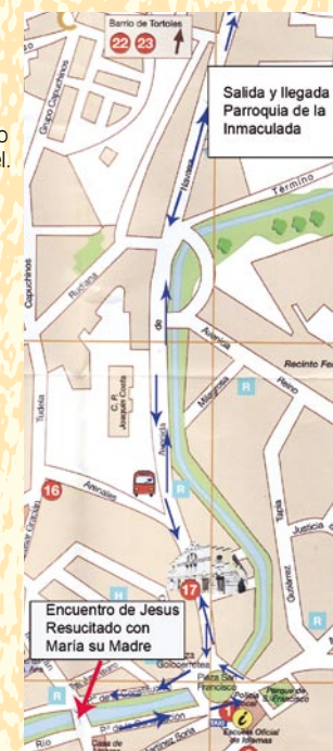
Recorrido de la Procesión