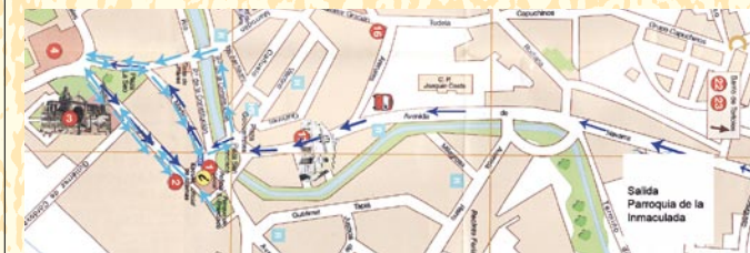
Recorrido de la Procesión